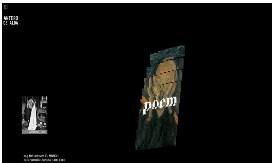
Figura 1- Apresentação inicial do poema Puzzle

A título de ilustração, é possível citar as experimentações semióticas de Antero de Alda, as quais surgem acompanhadas de uma iconografia lírica que possibilitam, além de uma gama de manipulações, a capacidade de gerar novas criações de sentido da palavra, em contexto poético. Assim, analisar-se-á um texto do autor em questão, procurando verificar como cada uma das particularidades (palavra, imagem, som, movimento e interatividade) se forma nos cibertextos como um todo. Para este estudo, foi selecionado como objeto de análise o ciberpoema Puzzle , disponível em http://www.anterodealda.com/puzzle_poem.htm , o qual pode ser observado na imagem a seguir: